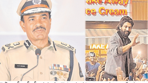
చెప్పారో, లేదో తమకు తెలియదని అన్నారు. తొక్కినలాట ఘటనపై దర్యాప్తు కొనసాగుతోందని, న్యాయపరమైన సలహాలు తీసుకొని ముందుకెళ్తామని తెలిపారు.

పోలీసు ఉన్నతాధికారులే వెళ్లి ఆయన్ను బయటకు తీసుకెళ్లాల్సి వచ్చిందన్నారు. అలాగే ఆయన వెళ్లిపోయేటప్పుడు కూడా కారు రూఫ్ నుంచి బయటకు వచ్చి చేతులు ఊపారని సీఎం వెల్లడించారు. కానీ, అల్లు అర్జున్ మాత్రం తనకు డియేట్ లో వద్ద మహిళ చనిపోయిన సంగతి ఎవరూ చెప్పలేదని మీడియా సమావేశంలో తెలిపారు. మహిళ మరణించిన విషయం మరుసటి రోజు ఉదయం 10 గంటలకు తనకు తెలిసినదన్నారు. తనపై చేసిన ఆరోపణలన్నీ అవాస్తవమని, వ్యక్తిత్వ హానం చేస్తున్నారని చెప్పారు. ఈ నేపథ్యంలో ఈ నెల 4న రాత్రి సంద్య డియేట్ లో వద్ద అసలేం జరిగిందనే దానిపై ఆదివారం మీడియా తో సహా 'మినిట్ టు మినిట్' వివరాలను హైదరాబాద్ పోలీస్ కమిషనర్ సీపీ ఆనంద్ మీడియాకు చూపారు. ఆ రోజు రాత్రి 9 నుంచి 12 గంటల వరకు జరిగిన ఘటనలను వివరించారు. అనంతరం ఆయన మాట్లాడుతూ.. పుష్ప-2 ప్రీమియర్ షో చూడడానికి అల్లు అర్జున్ డియేట్ కు రావడం పోలీసులు స్పష్టంగా చెప్పారన్నారు. ఆయన రాకకు అనుమతి ఇవ్వలేదని.. ఈ విషయాన్ని డియేట్ యజమాన్యం అర్జున్ కు