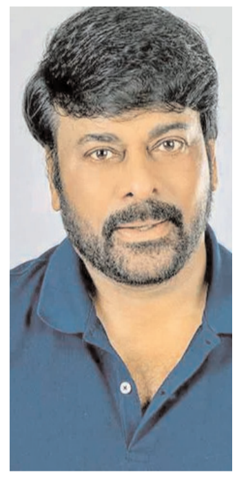
రెండు సినిమాలు పూర్తయ్యాక, ఈ మెగా ప్రాజెక్ట్ ఉంటుందట. ఈ వార్త ఫిల్మ్ వర్గాల్లో షాకడంతో కుర్ర డైరెక్టర్కు అవకాశాలిస్తూ భిన్నమైన ప్రయాణాన్ని చిరంజీవి సాగిస్తున్నారని పలువురు అభిప్రాయపడుతున్నారు.