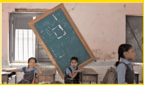
నంబర్ వన్ స్కూలం ముఖ్యమా... విద్యార్థుల భవిష్యత్తు ముఖ్యమా..?

ఉపాధ్యాయుల తీరే పాఠశాలకు శాపమా..!!.. ఉద్యోగం కంటే వ్యక్తిగత వ్యాపారం వైపే మొగ్గు..!?