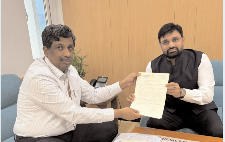
ఏలూరు పార్లమెంట్ నియోజకవర్గంలో జాతీయ రహదారుల పరిధిలో సర్వీస్ రోడ్డు, ఫై ఓవర్లు, కల్వర్టు పనులు తక్షణమే చేపట్టి ప్రమాదాలను నివారించడానికి చర్యలు చేపట్టండి. కేంద్ర రోడ్డు, రవాణా మరియు రహదారుల మంత్రిత్వ శాఖ కార్యదర్శి వి.ఉమాశంకర్ కు విజ్ఞప్తి చేసిన