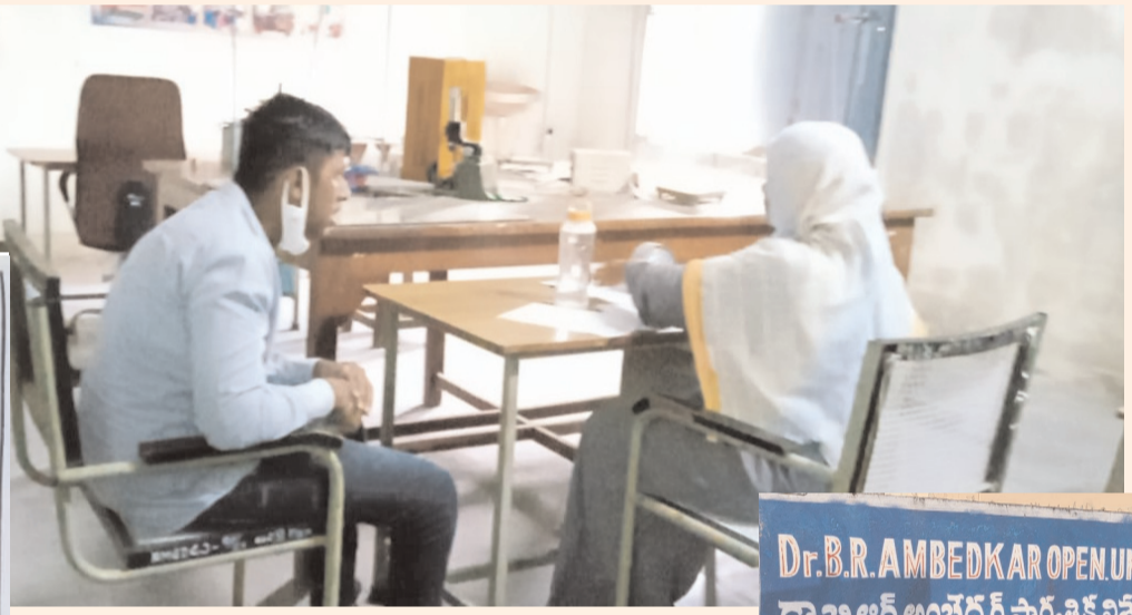
ఓపెన్ పరీక్షల్లో.. ఇంత ఓపెనా..?