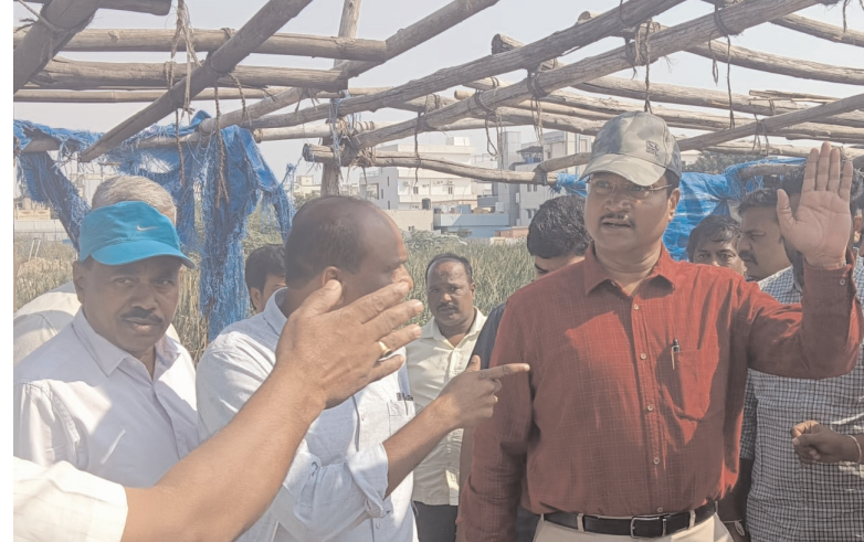
ఈ అంశంపై నిపుణుల కమిటీని వేసి నివేదికను తెప్పించుకుంటామని హైద్రా కమిషనర్ హామీ ఇచ్చారు. ఈ నివేదికను ప్రభుత్వానికి సమర్పిస్తామన్నారు. ప్రభుత్వం ఆదేశాల ప్రకారం చర్యలు ఉంటాయన్నారు