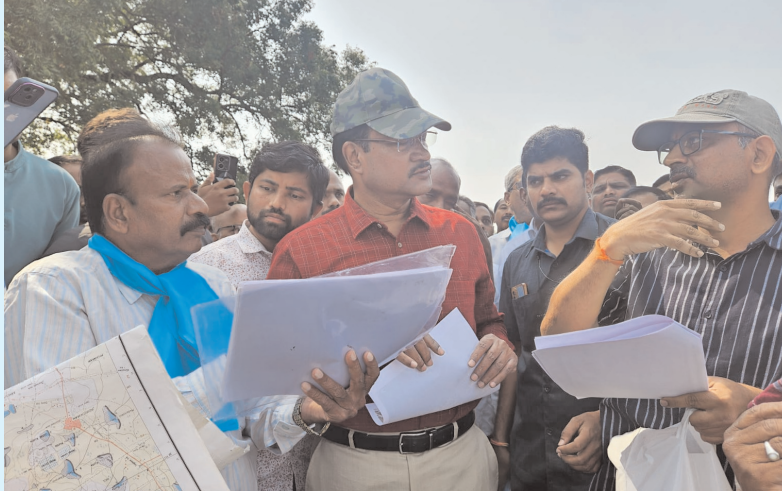
తమ భూములు కట్టాడు గురవుతున్నాయని స్థానికులు హైద్రా కమిషనర్ కు ఫిర్యాదు చేశారు. చెరువులోని నీరు తూముల ద్వారా కిందకు వదలడంతో ఎగువన ఉన్న తమ నివాసాలు మునిగిపోయినట్లు హైద్రా కమిషనర్ దృష్టికి తీసుకు వెళ్లారు.