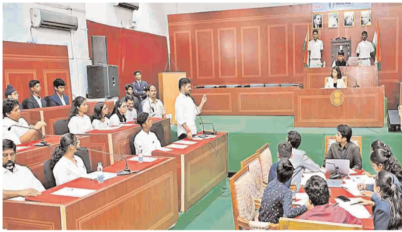
(మొదటి పేజీ తరువాయి)

అందులో చేర్చాలి, రాజకీయ, విద్య, ఉద్యోగ రిజర్వేషన్లు పెంచాలి కాంగ్రెస్ పార్టీ కట్టుబడి పని చేస్తుంది తెలిపారు. విద్యార్థులకు దొడ్డు బియ్యం, కుళ్లినీ కురగాయలతో ఆహారాన్ని పెడితే ఊరుకోబోమని, నాసిరకం అన్నం పెట్టేవారు, సరఫరాదారులు కటకటాలపాలేనని హెచ్చరించారు.