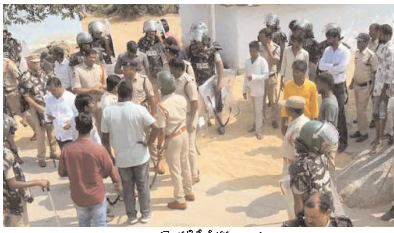
(మొదటి పేజీ తరువాయి)

హాజరైన కలెక్టర్ సహా ఉన్నతాధికారులపై దాడికి పాల్పడిన విషయం తెలిసిందే. ఈ క్రమంలో రాత్రి ఒంటిగంట సమయంలో లగచర్లకు చేరుకున్న సుమారు 300 మంది సాయుధ పోలీసులు 2 గంటల ప్రాంతంలో లగచర్ల, రోటిబండతండా, పులిచర్లకుంట తండాలును అడ్డ దిగ్బంధనం చేశారు. ఇళ్లలో నిద్రిస్తున్న రైతులు, యువకులను అదుపులోకి తీసుకున్నారు. పిలిచినా స్పందించని వారి తలుపులు బద్దలుకొట్టి లోనికి వెళ్లారు. మూడు గ్రామాల్లో సుమారు 50 మందికి పైగా అదుపులోకి తీసుకున్నారు. ఇప్పటికే అనుమానితులను గుర్తించిన పోలీసులు వారి సెల్ ఫోన్ సిగ్నల్స్ ఆధారంగా గాలింపు చర్యలు చేపట్టారు. ఈ క్రమంలో పలువురిని అదుపులోకి తీసుకున్నారు. ఏ ఇంటిని చూసినా తాళాల్..