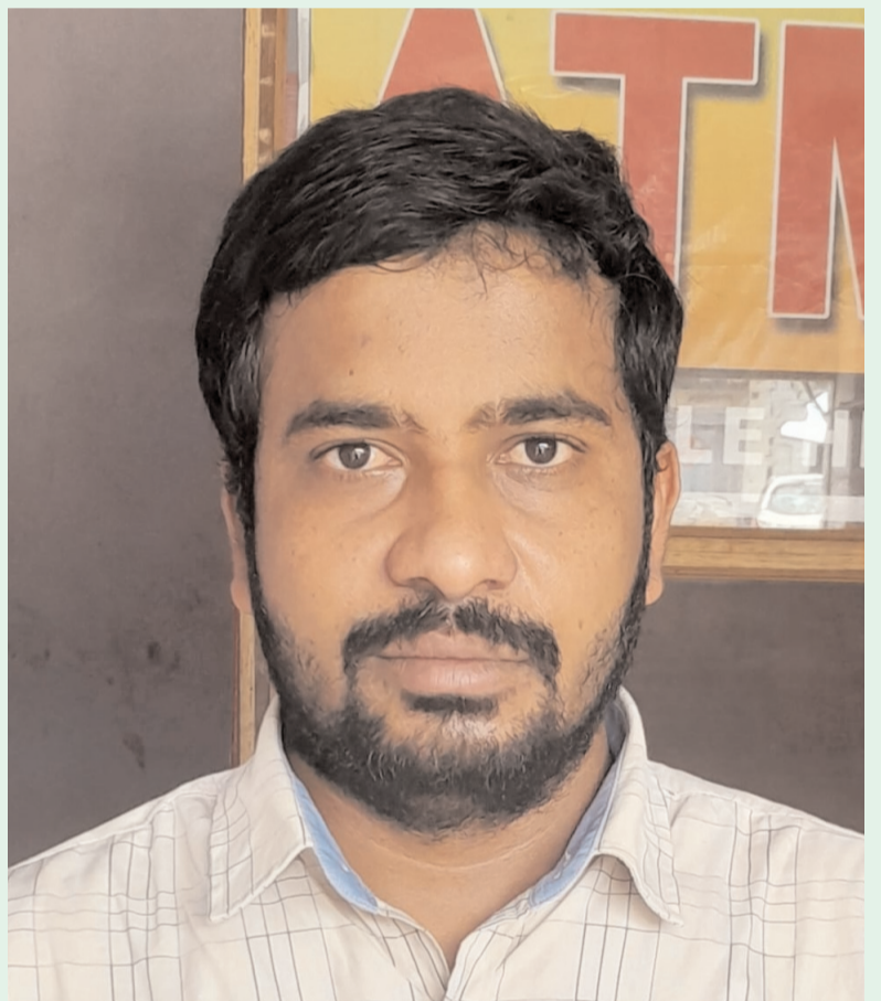
జనరిక్ మందుల వైపు వెళ్లడం లేదు. అందుకే వీటి వాడకాన్ని పెంచేందుకు కేంద్రం చర్యలు చేపడుతోంది. బయట మార్కెట్ రూ. 20కు దొరికే టాబ్లెట్ జనరిక్ మెడిసిన్ కేవలం రూ. 8 లభిస్తుంది.

జనరిక్ మందులు నాణ్యమైనవేనా? జనరిక్ అయినా బ్రాండెడ్ అయినా తయారీ నాణ్యత, పనితీరు ఒకే విధంగా ఉంటాయి. తయారీలోనూ, మార్కెటింగ్లోనూ అదనపు ఖర్చు ఉండదు కాబట్టి తక్కువ ధరల్లో లభించేందుకు సాధ్యమవుతుంది. కాలపరిమితి ముగియటంతో మొదటి ఉత్పత్తిదారుడు పేటెంట్ రైట్ కోల్పోవటంతో ఇతరులు వీటిని తయారుచేస్తారు. దీర్ఘకాలిక రోగాలకు 'జనరిక్' ఔషధాలు చాలా బాగా ఉపయోగపడతాయి. కానీ ఖరీదైన మందులకే ప్రజలు మొగ్గు చూపుతున్నారు. తక్కువ ధరే అయినా, ప్రజలు