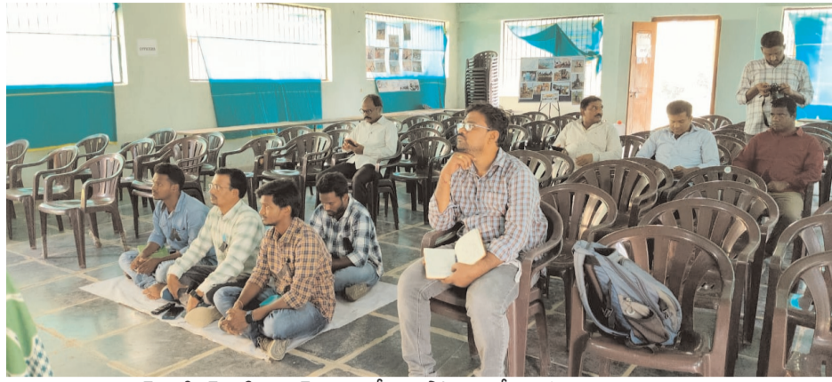
మహబూబాబాద్ జిల్లా కోత్తగూడ మండల వ్యవసాయ విస్తరణాధికారులు నల్ల బ్యాడ్జీలు ధరించి రైతు వేదికలో నిరసనను తెలియజేశారు. ఈ సందర్భంగా ఎకాడమి మాట్లాడుతూ గత నెల రోజులుగా వ్యవసాయ విస్తరణాధికారులు డిజిటల్ క్రాఫ్ సర్వేపై అభ్యంతరాలు తెలిపినందుకు గాను 12 రాష్ట్రాలలో అమలుచేస్తున్న విధంగా మన