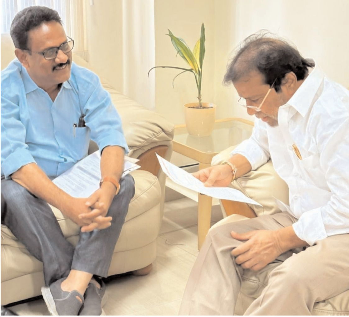
త్వరలో ఉన్నత స్థాయి సమావేశం: మంత్రి దామోదర రాజనరసింహా

ఆరోగ్య పథకం విషయంలో జర్నలిస్టులు ఆందోళన చెందాల్సిన అవసరం లేదని, ప్రభుత్వ ఉద్యోగులతో పాటు జర్నలిస్టులకు ఆరోగ్య పథకాన్ని పటిష్టంగా అమలుచేసే విషయంలో త్వరలో శాఖా పరంగా ఉన్నత స్థాయి సమావేశాన్ని నిర్వహించి చర్చిస్తామని టీయూడబ్ల్యూజే ప్రతినిధి బృందానికి మంత్రి దామోదర రాజనరసింహా హామీ ఇచ్చారు. ఈ పథకాన్ని బ్రస్ట్ డ్వారనైనా, ధర్మ్ పార్టీ ఏజెన్సీల ద్వారానైనా నిర్వహించేయకు ప్రభుత్వం పరిశీలిస్తున్నట్లు తెలిపారు. అధికారులతో సమావేశమై, తదుపరి జర్నలిస్టు, ఉద్యోగ సంఘాల బాధ్యులతో సమావేశం నిర్వహిస్తామని మంత్రి స్పష్టం చేశారు.