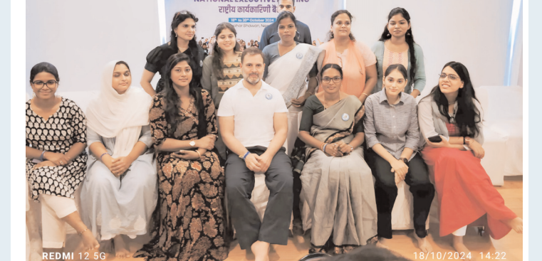
“శక్తి అభియాన్” జాతీయ కార్యవర్గ సమావేశంలో

న్యూఢిల్లీ: బాల్య వివాహం ఓ సామాజిక దురాచారమని, పర్సనల్ చట్టాలు, వాటిలోని సంప్రదాయాలు బాల్య వివాహ నిరోధక చట్టాన్ని అడ్డుకోజాలవని సుప్రీంకోర్టు పేర్కొంది. మైనర్ గా ఉన్నప్పుడే వివాహం చేయటం వల్ల తనకు నచ్చిన జీవిత భాగస్వామిని ఎంచుకునే అవకాశం సదరు వ్యక్తులు కోల్పోతారని గుర్తు చేసింది. బాల్య వివాహ నిరోధక చట్టాన్ని సమర్పవంతంగా అమలు చేసేలా ఆదేశాలు జారీ చేయాలని కోరుతూ 'సేవ' అనే స్వచ్ఛంద సంస్థ దాఖలు చేసిన ప్రజాప్రయోజన వ్యాజ్యం (పిల్)పై ప్రధాన న్యాయమూర్తి జస్టిస్ చంద్రచూడ్, జస్టిస్ జేపీ పారివాలా, జస్టిస్ మసీద్ మిత్రాలతో కూడిన ధర్మాసనం శుక్రవారం విచారణ జరిపి 141 పేజీల తీర్పును వెలువరించింది.బాల్య వివాహాల నిరోధానికి తొమ్మిది శీర్షికల కింద పలు మార్గదర్శకాలను కేంద్ర, రాష్ట్ర ప్రభుత్వాలకు, కేంద్రపాలిత ప్రాంతాలకు, సంబంధిత ప్రభుత్వ సంస్థలకు ఈ తీర్పులో సుప్రీంకోర్టు జారీ చేసింది. బాల్య వివాహ నిరోధక చట్టం అమలుకు జిల్లా స్థాయిలో ప్రత్యేకంగా కొందరు అధికారులను నియమించాలని, వారికి ఇతర బాధ్యతలే అప్పగించకూడదని ఈ మార్గదర్శకాల్లో సుప్రీంకోర్టు తెలిపింది. చట్టం అమలు తీరుపై మూడునెలలకోసారి సర్వే నిర్వహించాలని నిర్దేశించింది.జిల్లా స్థాయిలో బాల్యవివాహాలను నిరోధించే బాధ్యత ఆయా జిల్లాల కలెక్టర్లు, ఎస్పీలు తీసుకోవాలని పేర్కొంది. అంతేకాక, ఒక ప్రత్యేక పోలీసు విభాగాన్ని కూడా ఏర్పాటు చేయాలని ఆదేశించింది. బాల్యవివాహ ఘటనలపై న్యాయమూర్తులు కూడా సూమోట్ గా తీసుకొని ఆదేశాలు జారీ చేయాలని తెలిపింది.