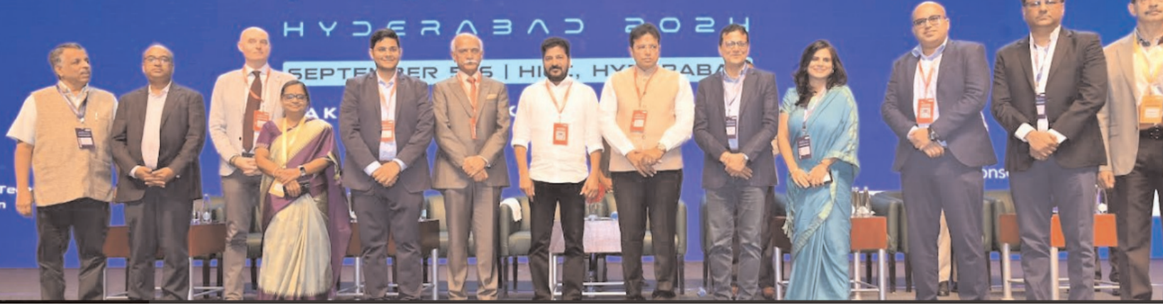
(మొదటి పేజీ తరువాయి)

ఏఐఐఐ ప్రోత్సహించే క్రమంలో ఎదురయ్యే సవాళ్లను స్వీకరిస్తూనే భవిష్యత్తును సృష్టిస్తామన్నారు. గతంలో వచ్చిన పారిశ్రామిక విప్లవాన్ని భారత్ సరిగా అనుసరించలేక పోయిందని ఈ సందర్భంగా సీఎం పేర్కొన్నారు. హైదరాబాద్ ఇంటర్నేషనల్ కన్వెన్షన్ సెంటర్ (హెచ్ఐసీసీ)లో రెండురోజుల పాటు జరిగే 'తెలంగాణ గ్లోబల్ ఏఐఐఐ సదస్సు'ను గురువారం ప్రారంభించిన అనంతరం ఆయన మాట్లాడారు. కొత్తగా నిర్మితమయ్యే ప్యూచర్ సిటీని ఏఐఐఐ అభివృద్ధి చేస్తామని, అందులో నిపుణులు భాగస్వాములు కావాలని సీఎం రేవంత్ విలుపునిచ్చారు. 'తెలంగాణ ఏఐఐఐ, నాస్కామ్ భాగస్వామ్యంతో రాష్ట్రంలో ఏఐఐఐ ప్రోత్సాహం అమలు చేస్తామన్నారు. సాంకేతికత, అభివృద్ధిలకు లేకుండా సమాజంలో ఏ మార్పు సాధ్యం కాదని చెప్పారు. రైలు ఇంజన్, విమానం అభివృద్ధి ప్రపంచ స్వరూపం మారిపోగా.. కరెంటు, బల్బు, టీవీ, కెమెరా, కంప్యూటర్ వంటి అభివృద్ధిల ప్రపంచ గతిని మార్చడంలో కీలకపాత్ర పోషించాయని అన్నారు. టీవీ, కంప్యూటర్, ఇంటర్నెట్, మొబైల్ ఫోన్లు చూడటం మన తరం చేసుకున్న అభ్యుత్సాహిని పేర్కొన్నారు. అయితే ప్రస్తుతం ఏఐఐఐ కొత్త టెక్నాలజీ వచ్చిన సమయంలో.. ఓ వైపు జీవితం మెరుగు పడుతుందనే ఆశ ఉండగా, మరోవైపు ఉద్యోగ భద్రత ఉండదనే భయం కూడా సమాజంగానే ఉత్పన్నమవుతోందన్నారు. కానీ ఏఐఐఐ టెక్నాలజీని ప్రోత్సహించడంలో తమ ప్రభుత్వ చిత్తపడిన శంకించాల్సిన అవసరం లేదని సీఎం స్పష్టం చేశారు.