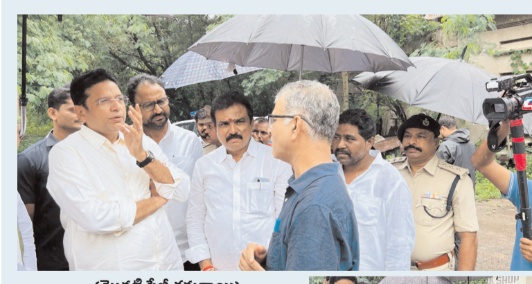
(మొదటి పేజీ తరువాయి)

కామారా ప్రజలు తమకు రోడ్డు సౌకర్యం కావాలని, మాండగడ ప్రజలు పంట నష్టపోయిన రైతులకు పంట నష్టం అందించాలని కోరారు.. దీనికి మంత్రి సానుకూలంగా స్పందించి ప్రభుత్వం అన్ని వేళల ప్రజలకు అండగా ఉంటుందని భరోసా ఇచ్చారు.. జిల్లా అధికార యంత్రాంగాన్ని ఎప్పటికప్పుడు పరిస్థితిని సమీక్షించాలని ఆదేశించారు.. సర్వే చేసి వరదల వల్ల నష్టపోయిన పంటల వివరాలు సేకరించాలని ఆదేశించారు.. పంట నష్టపోయిన భాధిత కుటుంబాలను ప్రభుత్వం ఆదుకుంటుందని భరోసా ఇచ్చారు.. ఈ కార్యక్రమంలో కాంగ్రెస్ శ్రేణులు, కార్యకర్తలు, నాయకులు, జిల్లా అధికారులు ప్రజాప్రతినిధులు పాల్గొన్నారు..