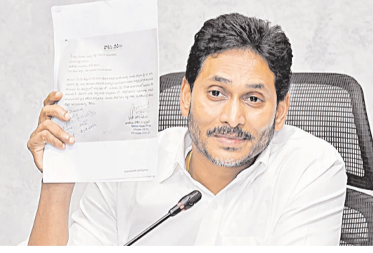
జూన్ 25, జూలై 4న వచ్చిన ట్యాంకర్లన్నీ టెస్టుల్లో పాస్ అయి ముందుకు కదిలాయి. వాటిని లడ్డాల తయారీలో వాడారు. ఆ తర్వాత జూలై 6న రెండు ట్యాంకర్లు, జూలై 12న మరో రెండు ట్యాంకర్లలో వచ్చిన న్యాయ టీటీడీ టెస్టుల్లో ఫెయిల్ కావడంతో వెనక్కు పంపడానికి సిద్ధం చేశారు.

(మొదటి పేజీ తరువాయి) అమరావతి: తిరుమల శ్రీవారి లడ్డాల తయారీలో కల్లీ న్యాయని అసలు వాడలేదని టీటీడీ ఈవో అత్యంత స్పష్టంగా చెప్పినా సీఎం చంద్రబాబు రాజకీయం చేస్తానే ఉన్నారని.. ఆయన చెప్పినవన్నీ పచ్చి అబద్ధాలని ఒక్కొక్కటిగా రుజువు అవుతూ కనిపిస్తున్నాయని వైఎస్ఆర్ సీపీ అధ్యక్షుడు, మాజీ ముఖ్యమంత్రి వైఎస్ జగన్ మోహన్ రెడ్డి చెప్పారు.