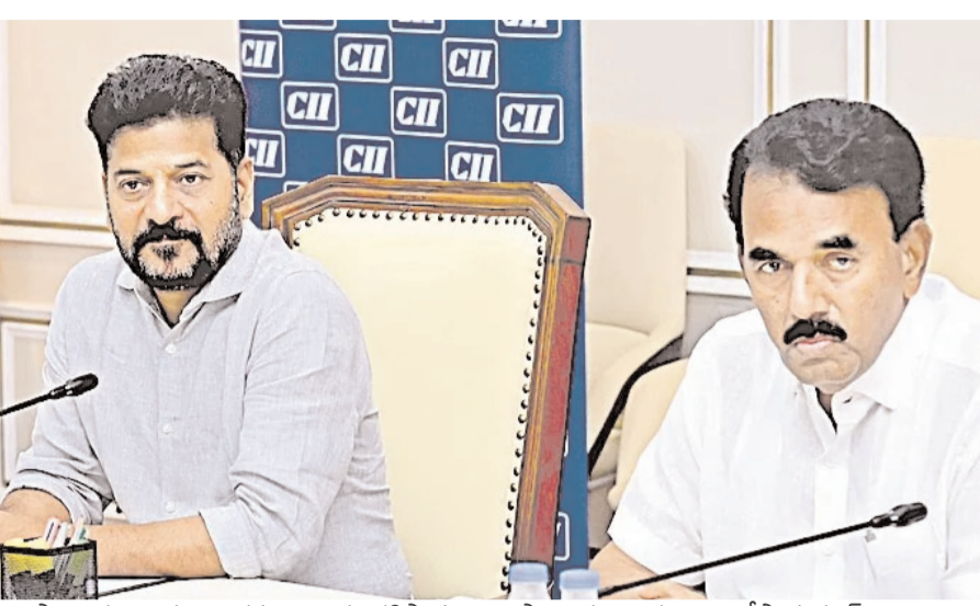
ఉస్మానియా ఆస్పత్రి భవనాన్ని పరిరక్షిస్తామని, ఉస్మానియా ఆస్పత్రిని గోషామహల్ స్టేడియానికి తరలిస్తున్నట్లు సీఎం ప్రకటించారు. హైకోర్టు భవనం, హైదరాబాద్ సీట్ కాలేజీ భవనంతో పాటు పురాసాహిత్య బ్రిడ్జి వంటి కట్టడాలను కూడా పరిరక్షిస్తామని,