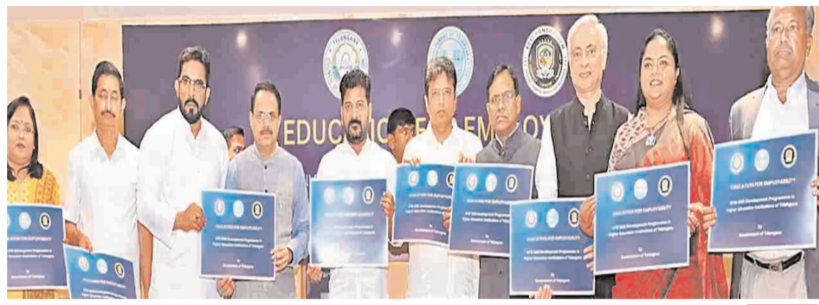
హైదరాబాద్: వచ్చే రెండు నెలల్లో మరో 35 వేల ఉద్యోగ నియామకాల దిశగా.. ప్రభుత్వం అన్ని చర్యలు తీసుకుంటుందని రాష్ట్ర ముఖ్యమంత్రి రేవంత్ రెడ్డి ప్రకటించారు. ప్రపంచానికి నైపుణ్యమున్న యువతను అందించడమే లక్ష్యంగా పెట్టుకున్నట్లు ఆయన వెల్లడించారు.

వచ్చే రెండు నెలల్లో మరో 35 వేల ఉద్యోగ నియామకాల దిశగా.. విద్యార్థులకు నైపుణ్య శిక్షణ ఇవ్వడం ప్రభుత్వ బాధ్యత వచ్చే ఏడాది నుంచి డిగ్రీ, ఇంజనీరింగ్ లో ఇంటర్నెషివ్.. కనీస ప్రమాణాలేని ఇంజనీరింగ్ కాలేజీల గుర్తింపు రద్దు ఉపాధి లేక వ్యసనాల బారిన పడుతున్న యువత.. బీఎఫ్ఎస్ఐ స్కిల్ ప్రోగ్రాం ప్రారంభోత్సవంలో సీఎం రేవంత్ రెడ్డి