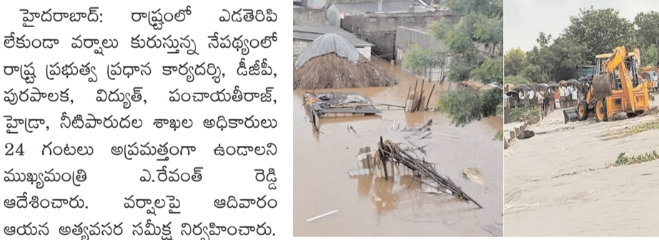
(మొదటి పేజీ తరువాయి)