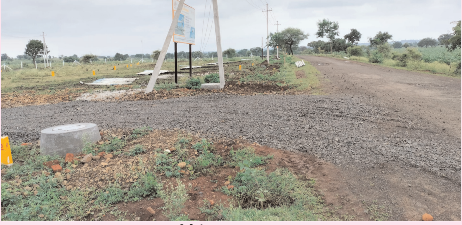
(మొదటి పేజీ తరువాయి)

తాగునీటి సౌకర్యం లేకుండా అంతర్గత రోడ్లను నామమాత్రంగా వేసి మారుమాటలు చెప్పి లక్షలు గడిస్తూ అమాయక కొనుగోలు దారులను అడ్డుంక ముంచేస్తున్నారు. గ్రామ పంచాయతీకి వెంచర్ లలో సరిపడా స్థలం కేటాయించకుండా డ్రైనేజీ, తాగునీరు, విద్యుత్ సౌకర్యాలు లేకుండా