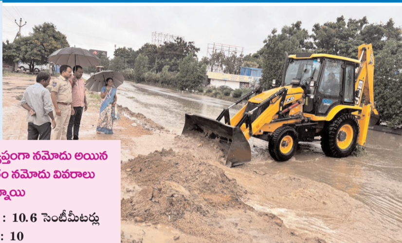
జిల్లా వ్యాప్తంగా నమోదు అయిన వర్షపాతం నమోదు వివరాలు ఇలా ఉన్నాయి