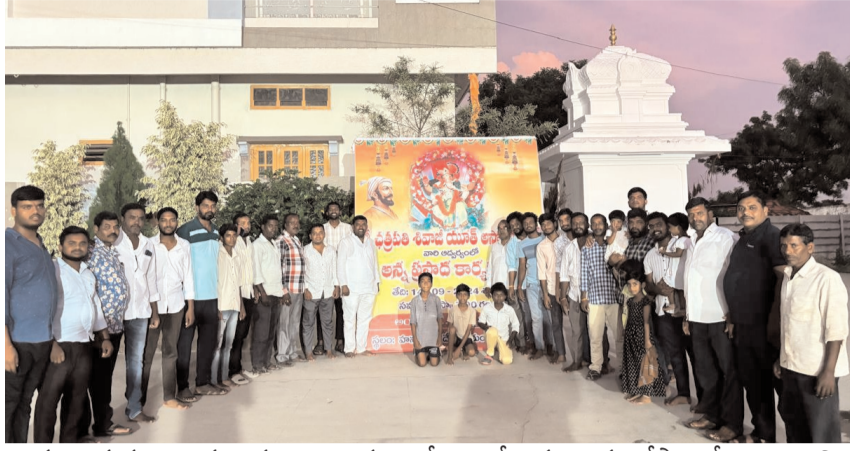
మాట్లాడుతూ గ్రామ ప్రజలు ఆయురారోగ్యాలతో, సుఖ సంతోషాలతో ఉండాలని కోరుకున్నారు. చత్రపతి శివాజీ యూత్ ఆధ్వర్యంలో అన్నదాన కార్యక్రమం చేసినటువంటి యువత ను అభినందించారు. ఈ కార్యక్రమంలో చత్రపతి శివాజీ యూత్ సభ్యులు, గ్రామ పెద్దలు మహిళలు పాల్గొన్నారు.