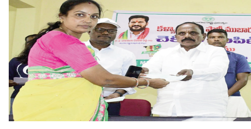
వివిధ శాఖల అధికారులు, సిబ్బంది, మహిళలు యువతులు పాల్గొన్నారు..