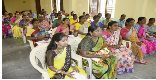
సీఎం రేవంత్ రెడ్డి ముఖ్య అక్షయపని పేర్కొన్నారు. ఈ కార్యక్రమంలో